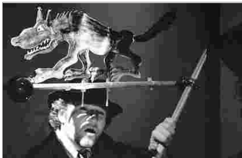
Das TheaterFusion Berlin & Erfreuliches TheatErfurt" gastiert mit „7 Geißlein warten auf den Weihnachtsmann“ in Roetgen.

„Ich wünsche mir, dass auch in 1000 Jahren zu Weihnachten immer noch Schnee liegt.“