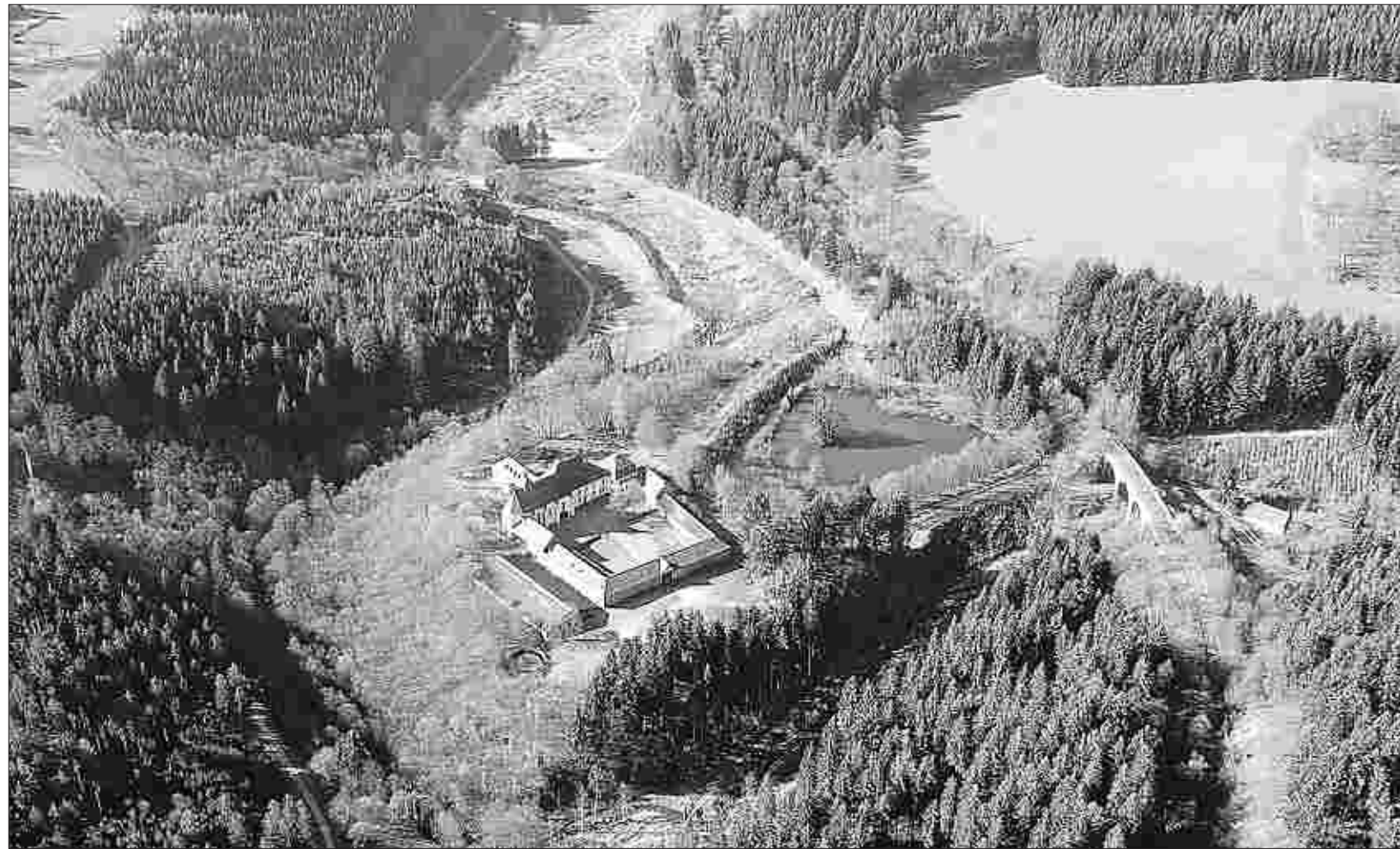
Nach langen Vorverhandlungen wurden jetzt durch die Unterzeichnung der notariellen Verträge Fakten geschaffen: Das Kloster Reichenstein wird zu einem „Benediktinerkloster der Tradition.“

So wird ganz Deutschlands interessierte Naturfoto-Szene diesen zweifellos einzigartigen Landstrich bis ins kleinste Detail kennenlernen, ja mehr noch: Man erfährt auch noch viel über die Menschen in dieser Region, ihren von Ehrgeiz geprägten Charakter, ihren einzigartigen Sportsgeist, ihre Art, die Natur zu sehen und ihre Fähigkeiten, mit Niederlagen umzugehen. So wird der Fotowettbewerb zum Spiegelbild einer ganzen Region, die ergriffen von der Euphorie des jungen Nationalparks Eifel das Abbild der Natur in der Bilderflut zerfließen lässt. (P. St.)