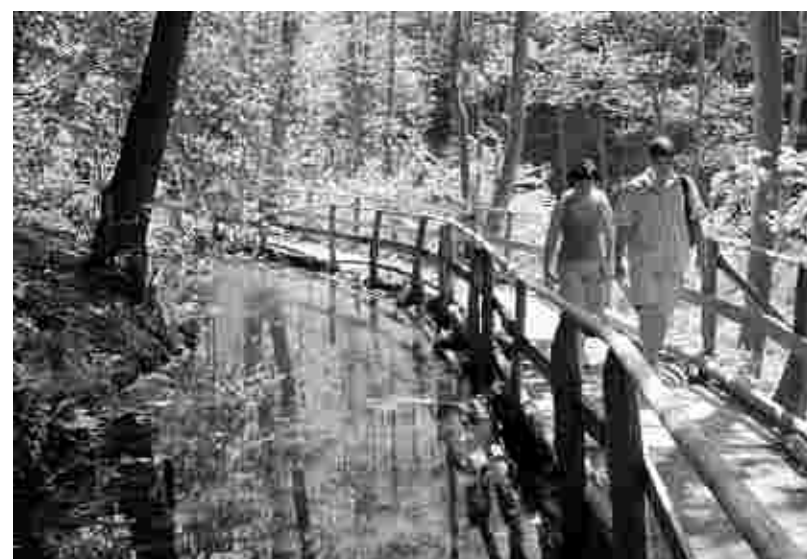
Für die schönsten Plätze in NRW wirbt ein neuer Reiseführer. Eine Wanderung entlang der Kall gehört auch dazu.

Zum Schluss bedankten sich die Lehrer und Schüler und Schülerinnen für die lehrreichen Fragestunden und die zahlreichen Informationen über die Arbeitsweise der EU in Brüssel. (sal)