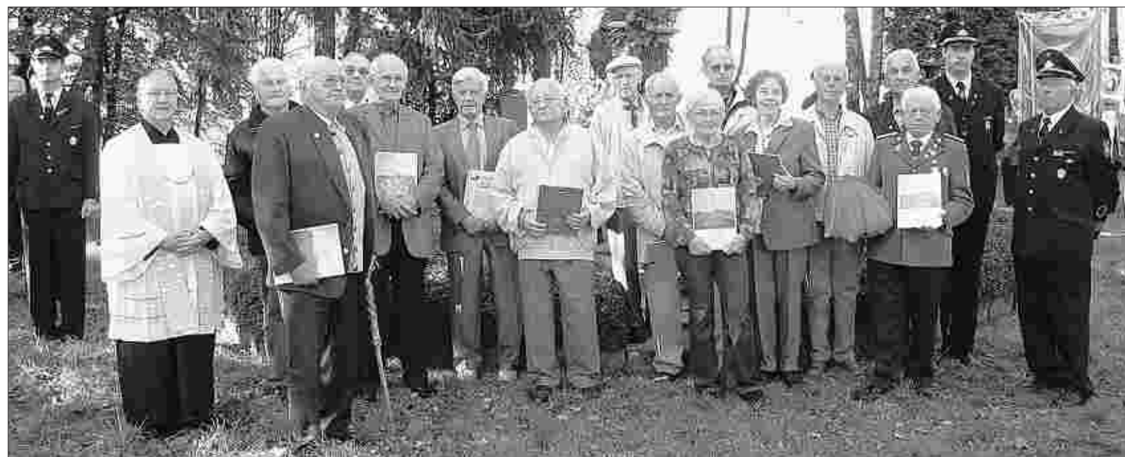
Die noch lebenden Kreuz-Bauer sowie Förderer und Pfleger der Kreuzwegstationen. Im Hintergrund sieht man den Stamm des „Eifelkreuzes“, geschmückt mit einem Ehrenkranz.