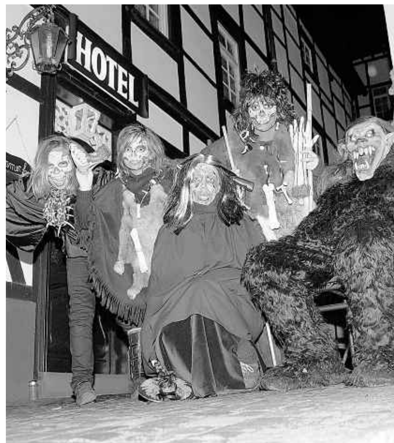
Happy Halloween: In Monschau wird am Wochenende kräftig gespuht. Es gibt schaurige Stadtführungen und ein buntes Programm auf dem Markt.

Rundgang , mit Einblick in Historie und Architektur der Anlage, 90 Minuten, 4 Euro pro Person, 14 Uhr, bis 31.12., Forum Vogel-sang.