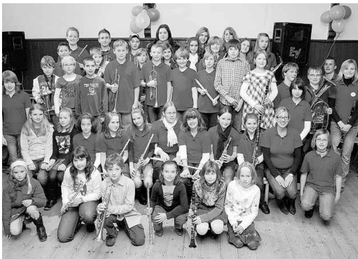
Immer ein imposantes Abschlussbild ist das Gruppenfoto der Musikschülerinnen und -schüler des MV „Eintracht“ Mützenich, zeigt es doch, wie viele Kinder und Jugendliche hier einer sinnvollen Freizeitbeschäftigung und einem schönen und nützlichen Hobby nachgehen. Beim alljährlichen Schülerkonzert am vergangenen Sonntag zeigte sich, was die Kinder und Jugendlichen im vergangenen Jahr im Einzelunterricht, wie auch im Jugendorchester dazu gelernt haben.