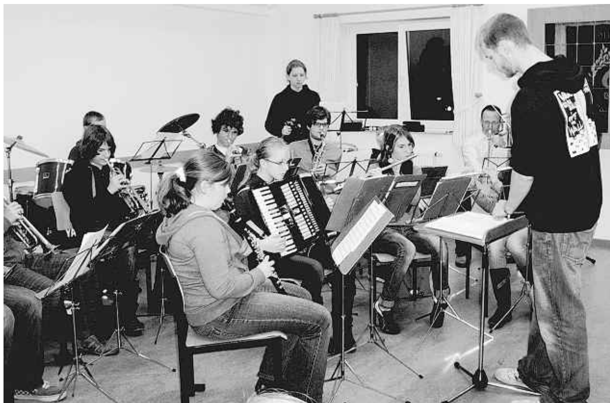
Das Jugendorchester des Musikvereins „Harmonie“ Imgenbroich gab am Freitagabend im Imgenbroicher Bürgercasino eine kleine Kostprobe seines Könnens. Auch die Einzelvorträge und die Instrumentenausstellung kamen bei den Besuchern gut an.

Auch die Jüngsten präsentierten mit ihren Blockflöten stolz, was sie in nur vier Monaten Unterricht gelernt hatten. Die beiden Mädchen wurden für ihren großen Mut von den Gästen mit einem kräftigen Applaus belohnt. Auch die Einzelvorträge an der Querflöte, der Trompete, dem Horn, dem