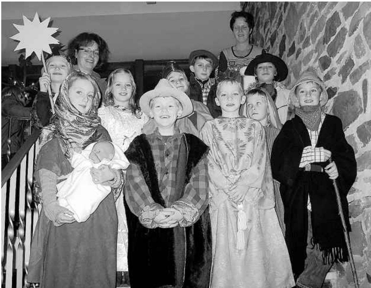
Eine seit 2000 Jahren unsterbliche Geschichte der Geburt Christi erzählten Einruhr-Erkensruhrer Kinder im liebevoll inszenierten Krippenspiel.

Den Höhepunkt des vorweihnachtlichen Markttreibens aber bildete die Aufführung eines Krippenspiels, eine Augenweide für das Publikum, insbesondere für die zahlreich darin vertretenen Großeltern der kleinen Akteure. Sieben Jungen und drei Mädchen,