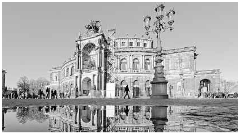
Die Semperoper in Dresden: Das Haus feiert am 13. Februar 2010 das 25-jährige Jubiläum nach der Wiedereröffnung 1985.