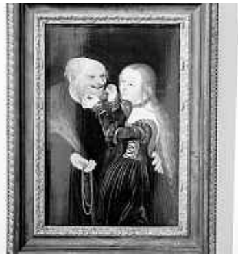
aber auch für seine protestantischen Freunde.

Seitdem er 1505 die feste Stellung als Hofmaler der sächsischen Kurfürsten innehatte, arbeitete er zusätzlich für Kaiser Maximilian I., für Albrecht von Brandenburg, für dessen Bruder Joachim I. Nestor und seinen Neffen, Joachim II. von Brandenburg und andere hohe Adlige, und gleichzeitig arbeitete er