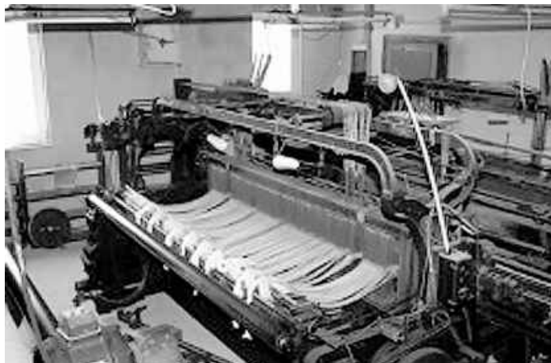
Mit den vier Webstühlen der ehemaligen Weberei Jansen, die noch bis 1975 in Höfen tätig war, ist das Webereimuseum als Zeitzeuge der alten Tradition des Webens eine interessante Adresse.

Im September können diese Materialien an folgenden Sammelstellen abgegeben werden: Stadtverwaltung Monschau, Laufstraße 84; Gemeindeverwaltung Roetgen, Hauptstraße 55; Gemeindeverwaltung Simmerath, Rathaus; Monschau-Touristik, Stadtstraße 16. Außerdem werden noch mottenfreie Rohwolle, Handspindeln, Häkelnadeln bis 3,5 mm, alte Webrahmen und Webkämme benötigt. Ansprechpartner für die Spenden ist Anne Wangnick, ☎ 02471-2301 oder weben@wangnick.de