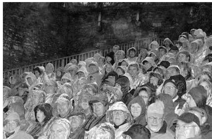
Das Publikum trotzte auf der Burg mit mitgebrachten oder vom Veranstalter bereit gestelltem Regenschutz dem immer wieder hereinbrechenden Regen.