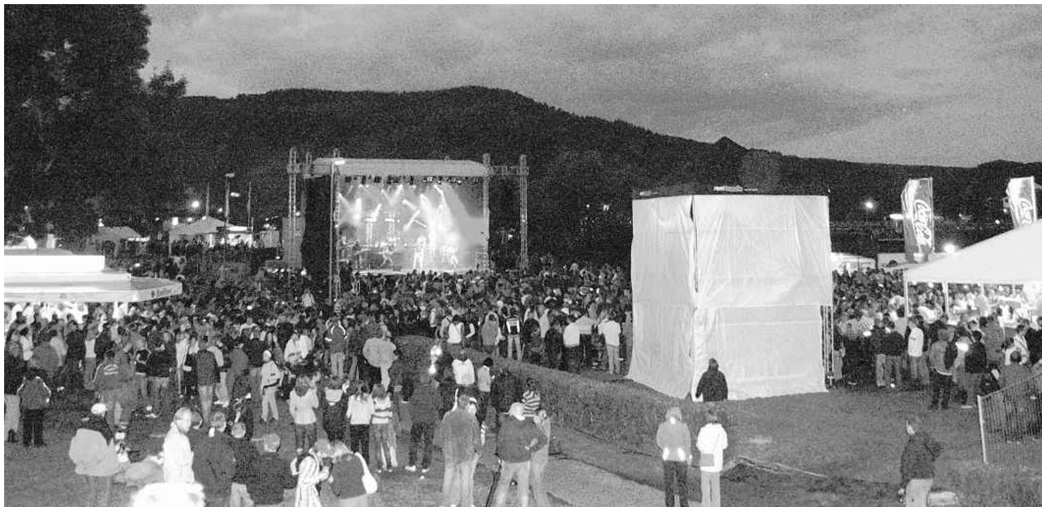
Auch in diesem Jahr heißt es beim Rursee Festival in Rurberg „Let it rock“, wenn der Live-Auftritt der Coverband „For Example“ die Massen zur Bühne am Antoniusshof lockt. Zusätzlich wird es in diesem Jahr auch wieder Rock und Pop „im Sief“ geben, also dort, wo „For Example“ zuvor abrockte. Dort spielt die Band „Hello“.