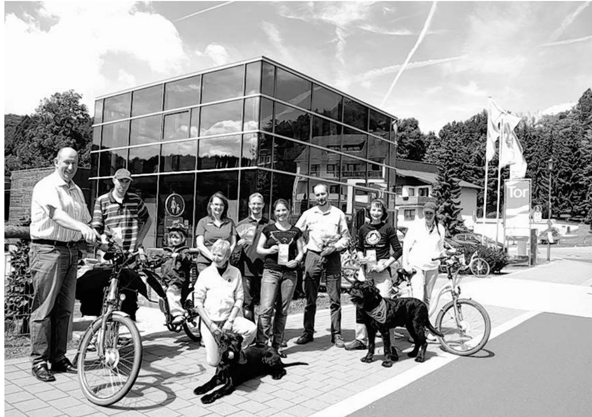
Sorgen in den Ferien für Abwechslung: In der Gemeinde Simmerath gibt es Sommer-Angebote für Kinder und Erwachsene.

Am 12. August werden die berüchtigten Indianer vom Stamm „Wilde Katze“ von 10.30 bis 15 Uhr am Rursee ihr Lager aufschlagen. Vormittags sind die tapferen Krieger im Alter von sechs bis zehn Jahren damit beschäftigt, Schmuck und Handwerkliches herzustellen, um sich mittags über Indianerbrot und Bärenatzen herzumachen. Nachmittags wird der Stamm das Gelände erkunden, eine Indianerprüfung ablegen und sich auf eine Schatzsuche begeben. Treffpunkt ist die Angelhütte am Eiserbachsee im Rurseezentrum in Rurberg. Informationen zu diesen Ange-