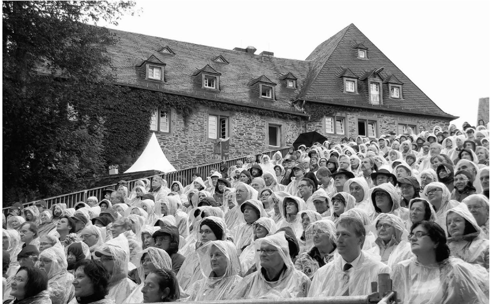
Mozart im strömenden Regen: Auf der Monschauer Burg waren Capes und trockene Tücher gefragte Utensilien. Die Musikfreunde nahmen's gelassen und genossen den Abend mit hervorragenden Solisten.

Als „Aminta“ machte Eva Lind den Zuhörern Freude, ihr wunderschöner Sopran kam in der Arie „L'Amoró“ aus der Oper „Il Ré Pastore“ klar und stark zur Geltung, ergreifend schön geriet das Zwiegespräch mit der Ersten Geige.