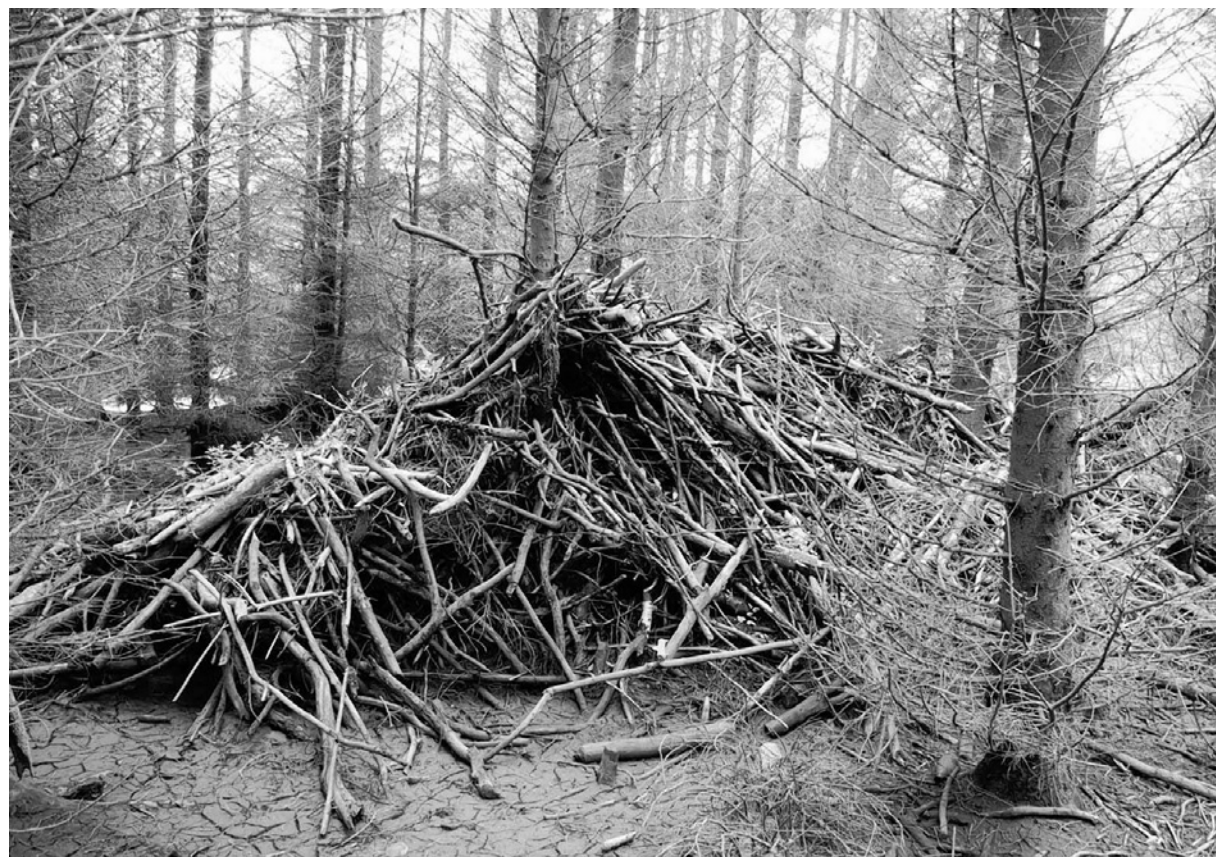
Die Biber haben in der Nordeifel einen festen Wohnsitz gefunden. Vor einigen Jahren errichteten sie diese Burg am Hexenplatz im Kalltal bei Simmerath.

Anfang des Jahres waren die Biber entlang der ehemaligen Vennstrecke zwischen Lammersdorf und Konzen aktiv, wo die wasserreichen Seitengraben sie zum Verweilen einluden.