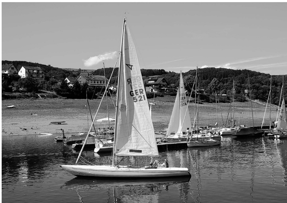
Für viele Segler ein kleines Paradies: Am Rursee bei Woffelsbach findet jetzt das erste integrative Jugendcamp statt.

Der Verein kann aber auch auf weitere Kooperationspartner bauen, wie jetzt bei der Vorstellung des Projektes im Simmerather Rathaus deutlich wurde. Dies sind die Caritas Lebenswelten, die Stadt Aachen und die Stadt Würselen. In Würselen hat der Förderverein bereits ein zweites Zuhause gefunden, fand doch auf dem Flugplatz