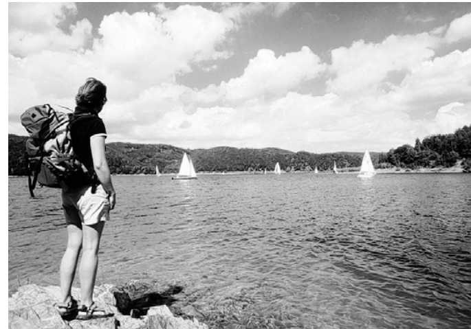
Gleich drei verschiedene „RURTAL Schlemmertouren“ laden zum Wandervergnügen ein.

Die Rücktour erfolgt nahe dem Seeufer, wobei viele