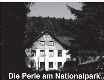
Die Perle am Nationalpark..

Ob zu einer Tasse Kaffee und einem guten Stück Kuchen, einer deftigen Brotzeit oder einem leckeren Menü - unser kreatives Küchenteam verwöhnt Sie gerne!