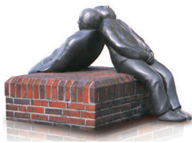
„Gegenseitigkeit“ – die Bronzeplastik der hannoverschen Künstlerin Ulrike Enders bringt den Gedanken „Versicherung auf Gegenseitigkeit“ auf einen einfachen und plakativen Nenner. (Direktionsgebäude)