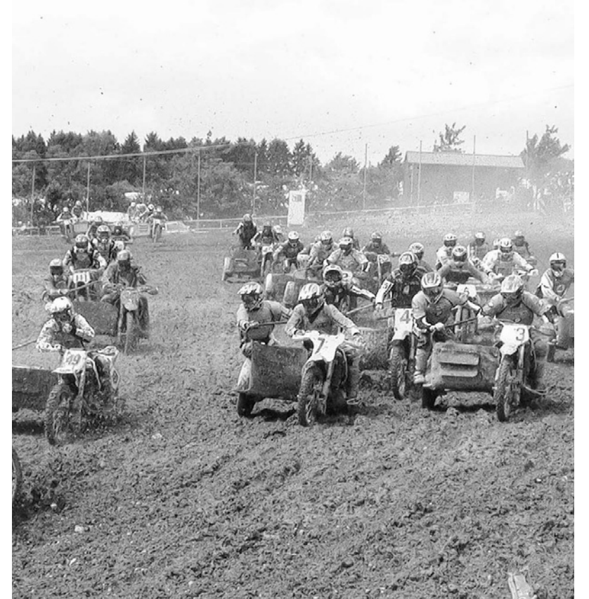
Auf dem Raffelsberg bei Kleinbau werden sich die Moto Cross-Fahrer wieder packende Zweikämpfe liefern. Die Zuschauer sind eingeladen, die Wertungsläufe an der Strecke zu verfolgen.

tag, 25. September ab 10.30 Uhr steht ganz im Zeichen des Jugendsports. Hier zeigen die „Weltmeister“ vom morgen, im Alter von fünf bis 16 Jahren in den Klassen 50 bis 125 ccm ihr Können. Zudem sind auch die Anfänger-, Junioren-, Damen-, Senioren und Veteranen Klassen am Start. In allen Leistungsklassen werden Fahrer des MSC Kleinbau reichlich vertreten sein, insbesondere in den Jugendklassen.