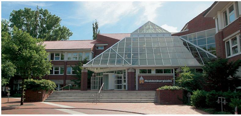
Direktionsgebäude der Mecklenburgischen Versicherungsgruppe in Hannover