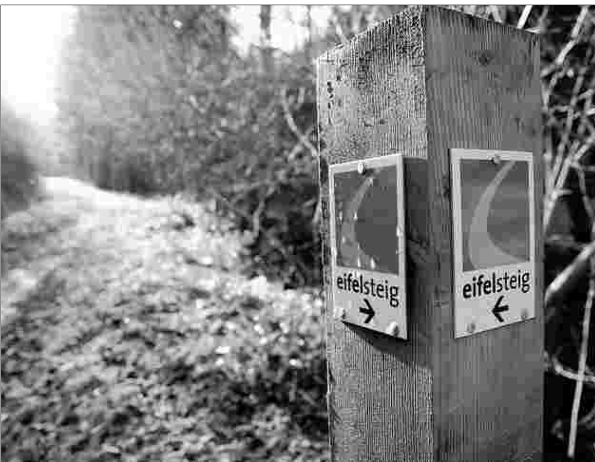
Ein Weg, der verbindet: Der Eifelsteig steht für die grenzüberschreitende Arbeit im Tourismus in der Region Eifel-Ardennen.

Und Etschenberg hat den Vergleich: Er war jetzt vom Bundestagsausschuss für Tourismus als Sachverständiger zum Thema „Länderübergreifende Tourismuskooperationen“ eingeladen und hat in Berlin Kollegen aus anderen Grenzregionen getroffen, unter anderem aus der Euroregion Pomerania (Mecklenburg-Vorpommern/Polen/Schweden), der Region Bayerischer Wald/Böhmerwald (Bayern/Tschechien) und der Region Schwarzwald (Baden-Württemberg/Frankreich/Schweiz). Ein wenig Stolz schwingt mit, wenn er sagt: „Wir sind die einzigen, die es geschafft haben, mit der Europäischen Wirtschaftlichen Interessen-