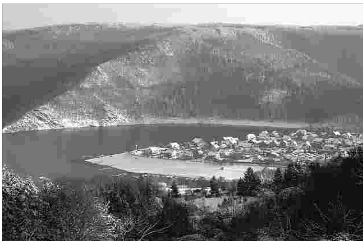
Auch im Winter ein Besuchermagnet: die Region rund um den Rursee.

Die Gemeinde wie Rursee-Touristik zeigten sich erleichtert und erfreut, „weil die Nachfolge im Erkensruhrer Wellness-Hotel dank einem neuen und hoffnungsvollen Träger gesichert scheint. Die Wiedereröffnung der Nobelherberge und schlüssige Betreiberkonzepte stimmten optimistisch. Die Stimmung in den Simmerather Hotel- und Gaststättenbetrieben sei gut,