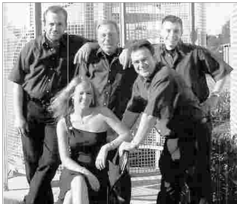
Die Kapelle „Nice Guys“ ist in unserem Raum bestens bekannt und wird bei der Musikwoche am Samstagabend für Partystimmung sorgen.

Die Musikvereinigung Montjoie lädt alle Freunde der Musik recht herzlich ein. Der Eintritt zu allen Veranstaltungen ist frei.