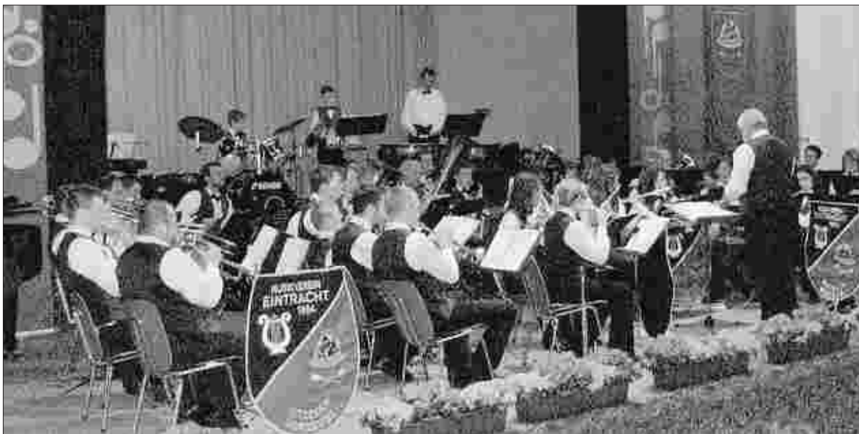
Bestens vorbereitet präsentierten sich die Aktiven des Musikvereins „Eintracht“ Mützenich bei ihrem traditionellen Frühjahrskonzert am Abend des Palmsonntags in der Aula des Monschauer Gymnasiums.

Eine der Stärken des Musikvereins Mützenich ist wohl die Marschmusik. Dem „Deutscher Regimentsmarsch“ (Wilhelm August Jurek) und dem „Florentiner Marsch“ (Julius Fucik) folgten jedenfalls stehende Ovationen des Publikums. Klar, dass hier nichts ohne Zugabe ging. Bei den Hits der legendären „Beach Boys“ gerieten alle nochmals ins Schwärmen, und wenn es nach dem Publikum gegangen wäre, hätte das Frühjahrskonzert ruhig noch weiter gehen können. (ges)