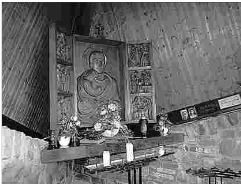
Der aus Eichenholz geschnitzte Altar aus dem Jahr 1942 prägt auch heute noch wesentlich den Innenraum der kleinen Kapelle an der Gabelung der Straßen Steindrich und Kapellenweg.

Als Pfarrer Fütting am Herz-Jesu-Fest 1940 einen Geldbrief (50 Mark) mit der Aufschrift „Für Reparatur vom Derichskapellchen“ erhielt, beschloss er im Sinne des Gelübdes bereits vor einer Erweiterung der Kirche die alte Kapelle in eine Josefskapelle umzuwandeln und stellte eine alte Josefstatue aus der Pfarrkirche