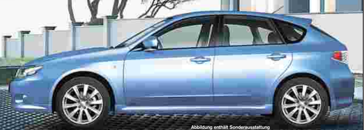
Abbildung enthält Sonderausstattung

Vom Erstplatzierten der ADAC-Kundenzufriedenheit 1 kommt jetzt der neue Impreza, der mehr ist, als nur ein Blickfang. Entdecken Sie seinen Komfort und seine Wirtschaftlichkeit bei einer Probefahrt bei Subaru, dem weltgrößten Hersteller von Allrad-PKW.