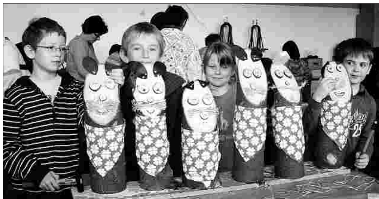
Basteln in der Holzwerkstatt: So wie diese fleißigen Bastler zeigte die ganze Grundschule Konzen beim Tag der offenen Tür, was sie zu bieten hat.