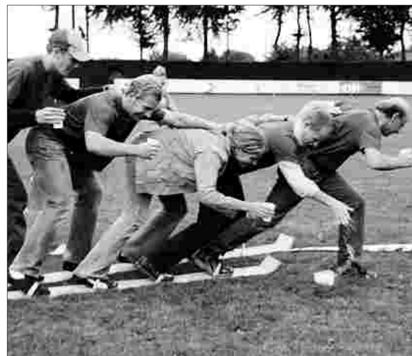
Das Spiel ohne Grenzen in Kesternich verlangt den Sportlern ungewohnte Fertigkeiten ab. Skifahren auf dem Rasen und gleichzeitigem Wassertransport ist nicht ganz einfach.