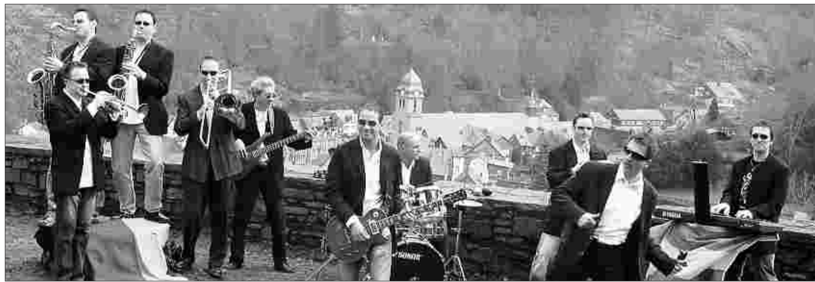
Keuners Tanzkapelle (hier beim Videodreh für den ghanaischen WM-Song auf der Burg Monschau) will am Samstag auf der „Offenen Bühne“ der Monschauer Musikwoche für Tanzmusik der besonderen Art sorgen: Ska und Reggae sind dann auf dem Marktplatz der Altstadt angesagt.

MONSCHAU. Die Kindergartenkinder und das Team des Monschauer Kindergartens feiern ein Fest und laden in den neuen Kindergarten St. Ursula in der Kirchstraße 24 ein. Das Fest findet statt am Samstag, 25. August, von 11 bis 14 Uhr.