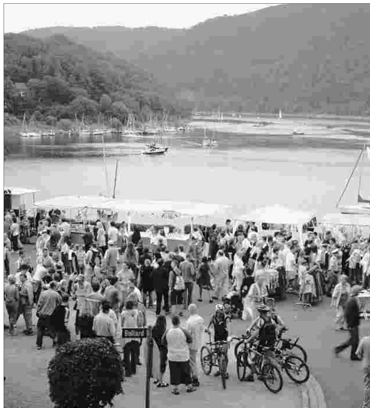
Das Rurseeefest (Bild) ist zusammen mit dem Monschauer Weihnachtsmarkt der größte Tourismus-Magnet der Eifelregion. Zehntausende Besucher strömen am dritten Juli-Wochenende an den See, schlendern über die Promenaden und bestaunen das Höhenfeuerwerk am Abend.

Eine wichtige Erkenntnis der Autoren des Barometers: „Der neue Nationalpark Eifel und die seit 2006 erstmals wieder öffentlich zugängliche Burg Vogelsang ziehen schon jetzt enorme Besucherströme an.“ Auf Vogelsang wurden im Jahr 2006 rund 140 000 Besucher gezählt, die Besucher im Nationalpark lassen