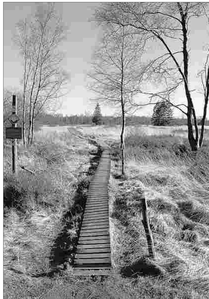
Einzigartige Landschaft: Das Hohe Venn wurde vor 50 Jahren von der belgischen Regierung zum Schutzgebiet erklärt.

„50 Jahre Landschaftsschutzgebiet Hohes Venn“ ist eine Ausstellung betitelt, die demnächst im Naturpark-Zentrum Botrange zu